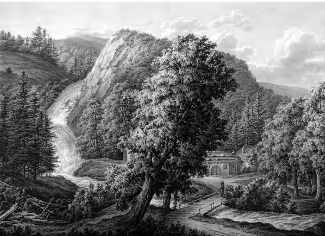
Péry (dt. Büberich) war eine der Ortschaften im Erguel, die Biel gerne an sich gezogen hätte, um einen eigenen Kanton zu bilden. Von Johann Joseph Hartmann (1752–1830). – Eigentum der Stadt Biel, Sammlung Museum Schwab.