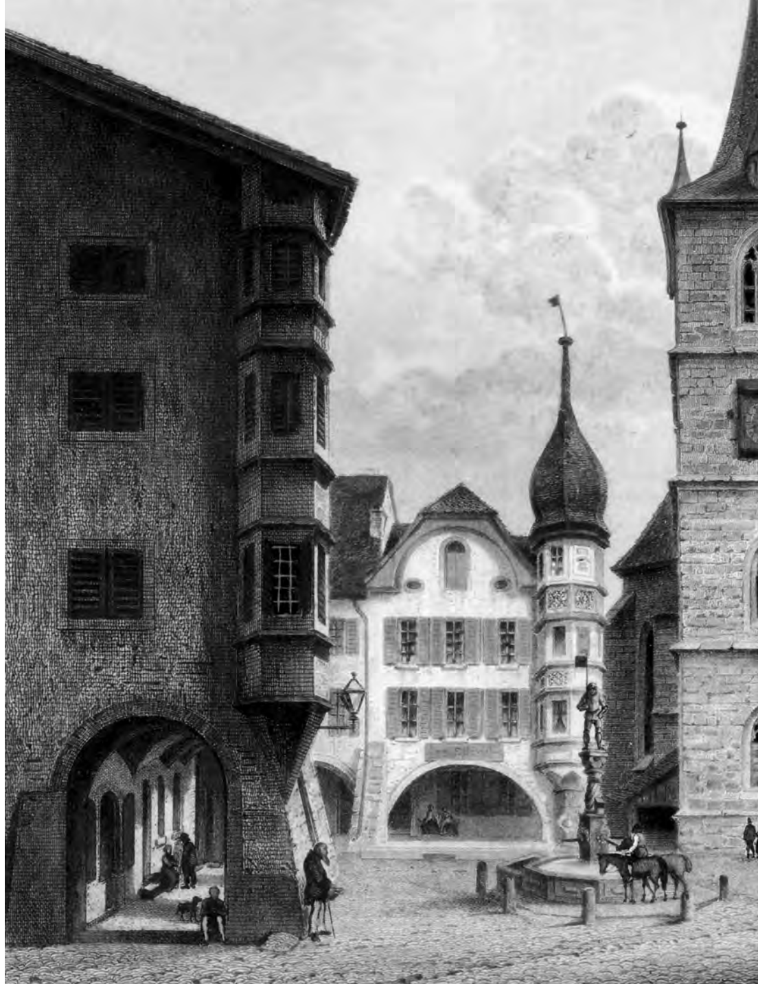
Der Ring (runder Platz vor der Stadtkirche) ist der älteste Teil der Stadt Biel. Von Christian Koehler (1809–1861), Ring in Biel mit Stadtkirche und dem Zunftthaus zu Waldleuten [Ausschnitt]. – Eigentum der Stadt Biel, Sammlung Museum Schwab.