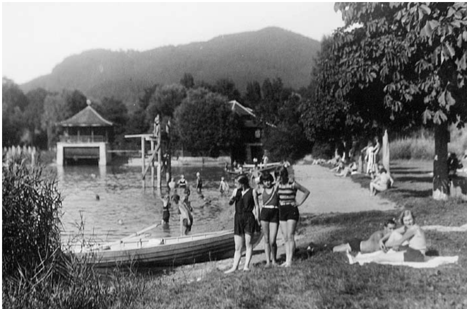
Abb. 14 Dieses Foto von 1928 hielt den Badebetrieb des ersten öffentlichen Seebads am Lachenkanal in Dürrenast fest. Während im Flussbad Schwäbis noch strikte Geschlechtertrennung herrschte, durften hier ab 1924 Männer, Frauen, Knaben und Mädchen am Wochenende gemeinsam baden.

Die Gäste der Badeanstalt im Schwäbis badeten streng nach Geschlechtern getrennt, und zwar nicht wie in vielen andern Bädern in verschiedenen