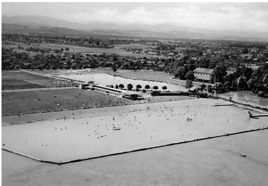
Abb. 15 Das undatierte Flugbild zeigt das 1933 eröffnete Strandbad Thun. Der Badebereich war durch einen Steg vom offenen See abgetrennt. Die Badetemperaturen waren oft eher kühl. 1962 wurde ein Teil dieses Beckens aufgefüllt, um die Liegewiese zu vergrössern.

Die Suche nach einem geeigneten Platz für ein Seebad gestaltete sich in Thun schwierig. In den 1890er-Jahren stand die Errichtung einer Badeanstalt an der Bächimatte zur Diskussion, das Projekt scheiterte jedoch an der Opposition der Anwohner. Die Technische Kommission des Gemeinderates schlug weitere Standorte vor, doch die Stadt Thun beschränkte sich vorläufig darauf, 1905 das Flussbad Schwäbis zu modernisieren. Erst 1922 entstand auf dem Lachenareal im Dürrenast die erste öffentliche Seebadeanstalt. Auch hier badeten Männer und Frauen vorerst abwechselnd, ab 1924 war das Bad am Wochenende für beide Geschlechter geöffnet. 117 Dies war ein erster vorsichtiger Schritt weg von einer traditionellen Badeanstalt zu einem offen konzipierten Strandbad, in dem es weder eine Geschlechter-