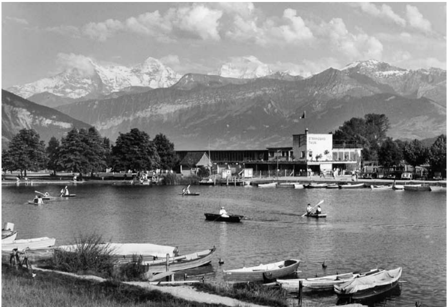
Abb. 16 Paddel- und Ruderboote auf dem Lachenkanal 1933. In diesem Jahr nahm das Thuner Strandbad seinen Betrieb auf. Im 20. Jahrhundert suchten immer mehr Menschen die Fluss- und Seeufer auf, um sich dort zu vergnügen und zu entspannen.

Auf der Aare war die Schifffahrt nach der Aare-Zulg-Korrektion nicht mehr möglich. Trotzdem gab es weiterhin einzelne Personen, die sich nicht davon abhalten liessen, den Fluss mit Booten zu befahren, allerdings nur noch als Freizeitbeschäftigung. Ein Hinweis auf solche Bootsfahrer findet sich schon 1867 in einer Thuner Zeitung. Zwei junge Engländer wollten mit einem Boot von Scherzligen via Aare, Bieler- und Neuenburgersee zum Genfersee gelangen. Ein genauerer Blick auf die Landkarte erübrigte sich jedoch, denn ihr Boot zerschellte schon an der oberen Schleuse, worauf sich die Sportsmänner schwimmend retteten und sich anschliessend im Restau-