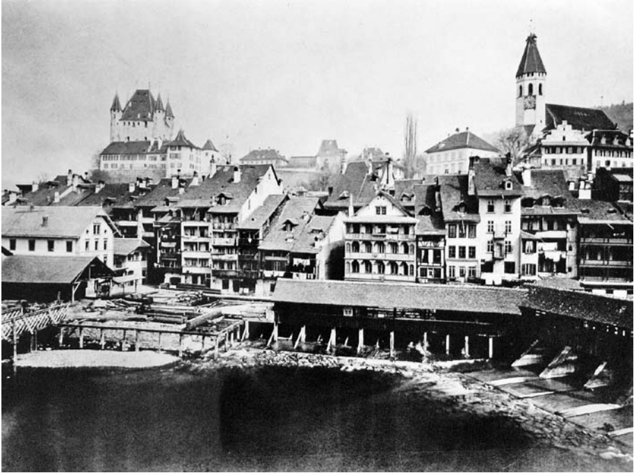
Abb. 9 Foto der Altstadt in den 1870er-Jahren. Rechts im Vordergrund befindet sich die untere Schleuse. Ganz links im Bild erkennt man unterhalb des Schlossberges die zwei Mühlegebäude, unter denen je ein Kanal durchfloss. Davor stand zudem eine Sägerei, die ebenfalls die Wasserkraft nutzte.

mit neuester Technik ausgestattet war. Es war weiterhin die Aare, welche die Energie für die Mahlwerke lieferte, allerdings nicht mehr mit Hilfe der traditionellen Wasserräder. Die neue Mühle war mit einem modernen Turbinenwerk ausgestattet, welches die Wasserkraft effizienter in mechanische Energie umsetzte. Damit war in Thun eine grosse, moderne Industriemühle entstanden, die 1886 dem eidgenössischen Fabrikgesetz unterstellt wurde und die der Konkurrenz die Stirn bieten konnte. 1889 beschäftigte die Mühle Lanzrein 13 Angestellte und gehörte zu den drei leistungsfähigsten Mühlen im Kanton Bern. Nach Adolf Lanzreins Tod wurde die Firma vorerst unter dem Namen Lanzrein's Söhne weitergeführt. 1926 fusionierte sie mit der 1900 gegründeten Firma Naef/Schneider und Cie. zur Mühlen AG, welche 1928 den Standort Thun teilweise elektrifizierte. 53