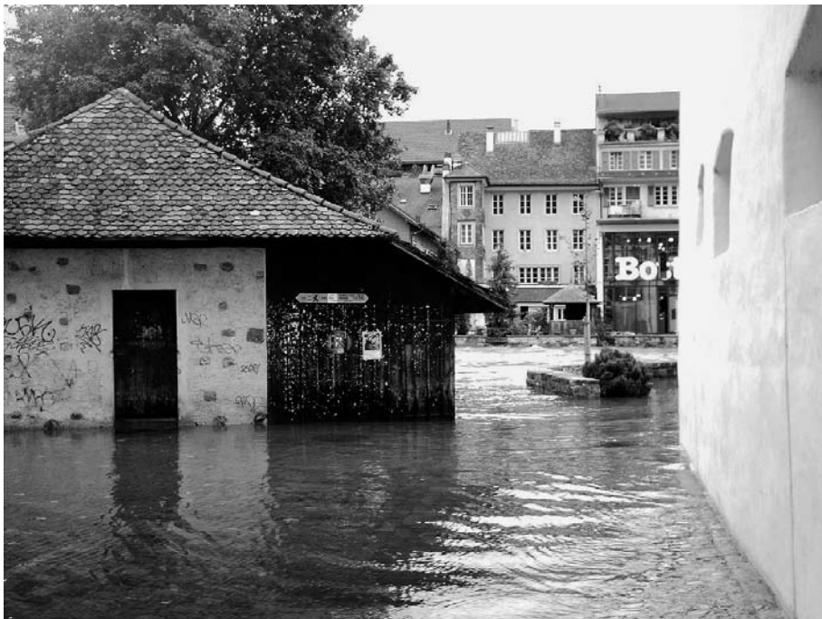
Abb. 2 Im Sommer 2005 stand Thun ein weiteres Mal unter Wasser. Der Wanderweg, der am alten Waschhaus beim Rathaus vorbeiführt, verwandelte sich in einen Wasserweg.