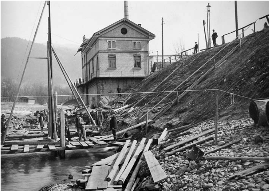
Abb. 10 Im Zentrum dieser Aufnahme von 1917 steht das erste Elektrizitätswerk, das die Stadt Thun 1895/96 an der Scheibenstrasse errichtete. Um unabhängiger von importierter Kohle zu werden, die im Ersten Weltkrieg zur Mangelware wurde, baute Thun 1917 nebenan ein weiteres Kraftwerk.

und auch unvorhergesehenen Erosion der Flusssohle durch die Aare-Zulg-Korrektion war hier das dafür nötige Gefälle entstanden.