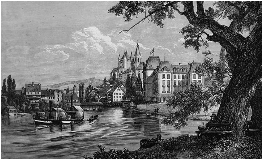
Abb. 13 Eine Aktiengesellschaft baute 1875 das Luxushotel Thunerhof. Wegen der damaligen Wirtschaftskrise und weil die Baukosten den Voranschlag massiv überschritten hatten, musste die Einwohnergemeinde den Thunerhof schon 1878 übernehmen; sie verkaufte ihn aber 1895 wieder an eine Aktiengesellschaft. 1942 erwarb die Stadt den Thunerhof zum zweiten Mal und brachte hier einen Teil der Stadtverwaltung unter. Der Stahlstich aus dem Jahr 1880 von Edward Compton (1849–1921) zeigt das Gebäude von Südosten.

Mit dem Aufschwung des Tourismus entstand ein wirtschaftlicher Druck auf dieses Quartier. In der zweiten Hälfte des 19. Jahrhunderts ent-