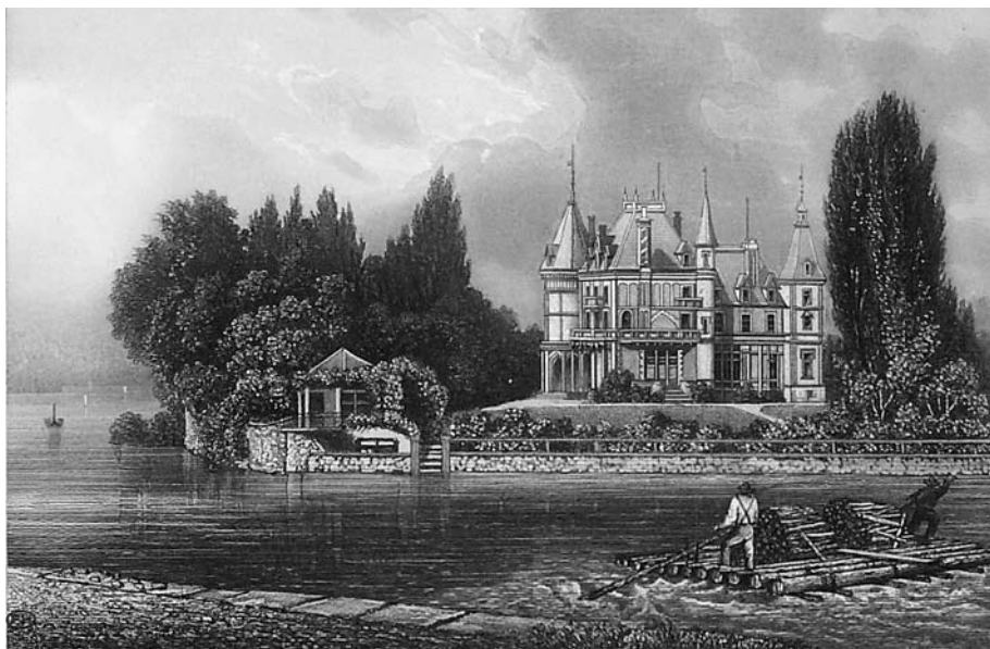
Abb. 5 Bis weit ins 19. Jahrhundert hinein wurde das Holz aus dem Alpenraum auf dem Wasserweg ins Unterland transportiert. Die Radierung von Jakob Lorenz Rüdüsühli (1835–1918), die um 1870 entstanden ist, zeigt einen Flösser auf der Aare vor dem Schloss Schadau.

Zudem war Thun seit dem Mittelalter Durchgangsstation für Holzflösse, denn der Wasserweg war die bequemste und billigste Art, Holz zu transportieren. Ab dem 17. Jahrhundert erliess der Staat Bern Bestimmungen, die den Holzschlag und die Flösserei reglementierten, damit die Wälder im Oberland nicht übernutzt wurden. Vor allem aber sollten die Erlasse die Holzversorgung der Hauptstadt sichern. Wie wichtig das Holz für Bern war, zeigt sich daran, dass auf der Aare unterhalb der Stadt Bern der Holzverkehr klein, oberhalb aber gross war. Noch um 1840 gingen durchschnittlich pro Jahr gut 33 000 Stämme Bauholz durch Thun. Nach dem Bau der Eisenbahnstrecke Bern–Thun von 1859 nahm die Flösserei zwischen Thun und Bern langsam ab. Die Stadt Thun war auch selber Holzkonsumentin, es gab hier verschiedene Lande- und Lagerplätze für Holz. An diesen Stellen befanden sich meist Gewerbebetriebe, die das Holz entweder als Brennmaterial brauchten oder es verarbeiteten. 20