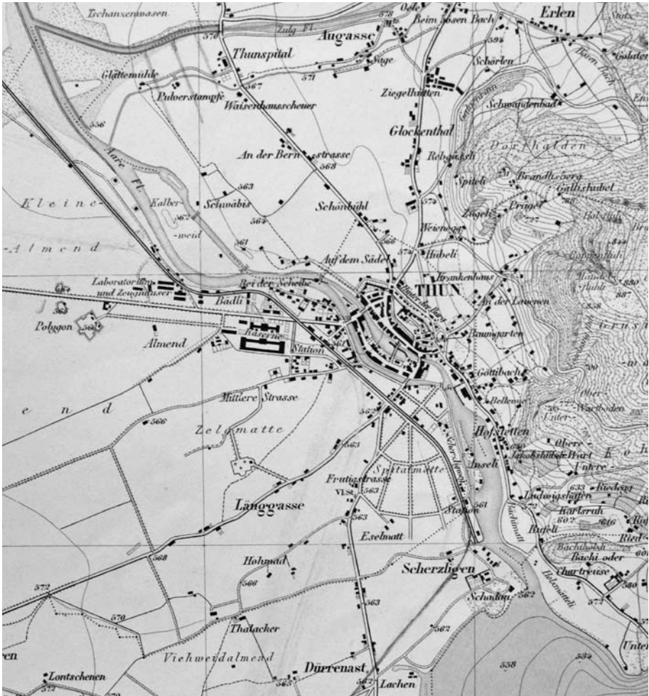
Abb. 1 Die Stadt Thun auf der Siegfriedkarte von 1876. Die Altstadt liegt nicht direkt am Thunersee, sondern rund einen Kilometer unterhalb des Ausflusses der Aare aus dem See.

gen. Dass Wasser zur Bedrohung werden kann, mussten die Menschen in Thun immer wieder erleben. Zudem hatte die Stadt mehrmals Folgen von Gewässerkorrekturen zu bewältigen. In den letzten 300 Jahren veränderte sich die Beziehung der Thunerinnen und Thuner zum Wasser grundlegend. Aare und See verloren zwar in verschiedener Hinsicht an Bedeutung, doch das Wasser blieb weiterhin wichtig für die Stadt. Diese Entwicklung soll in diesem Artikel facettenreich aufgezeigt werden. 2