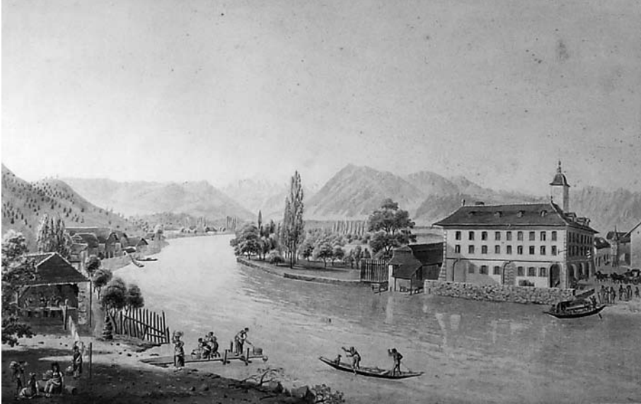
Abb. 11 Um 1820, als diese kolorierte Radierung von Jakob Samuel Weibel (1771–1846) entstand, wuschen die Thunerinnen ihre Wäsche meist in einem der vier öffentlichen Waschlhäuser, die alle aus praktischen Gründen in der Nähe der Aare standen. Ein Waschlhaus ist links im Bild zu sehen, rechts am anderen Aareufer steht das Hotel Freienhof.

liz und im Schwäbis. Der Betrieb der vier Waschlhäuser brachte der Stadt einen Gewinn, denn das Waschen war nicht gratis. Im 19. Jahrhundert benutzten die Wäscherinnen Aschelauge als Waschmittel, die sie nach Gebrauch in die so genannte Ascherichgrube schütteten. Dies brachte der Stadt weitere Einnahmen, denn sie verkaufte den Grubeninhalt als Düngemittel. 76