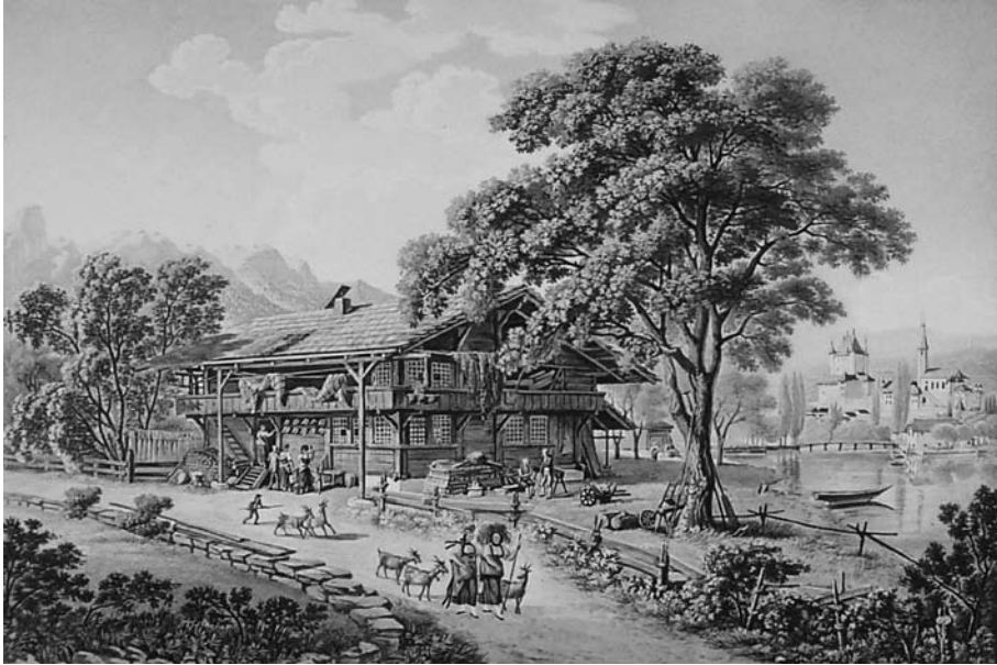
Abb. 7 Gabriel Ludwig Lory (1763–1840) bildete in den 1820er-Jahren das Fischerhaus in Scherzigen ab. Zum Trocknen aufgehängte Netze und neben der Tür angenagelte Fischköpfe weisen auf den Beruf des Hausbesitzers hin. Wie die meisten Fischer zu dieser Zeit wird er daneben wohl auch als Bauer gearbeitet haben.

sorgte dafür, dass weiterhin ein Drittel der Fische in Thun verkauft wurde. Die übrigen Fische lieferte er möglichst lebend an den Fischverwalter der Stadt Bern, für tote Fische erhielt er weniger Geld. 1784 gab die Berner Obrigkeit den Handel mit Fischen frei.