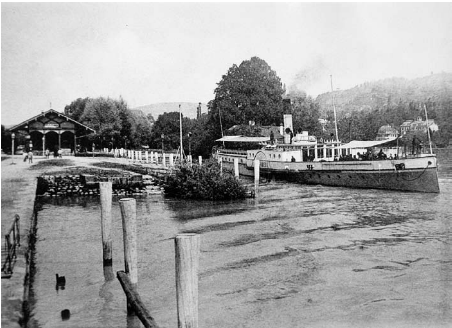
Abb. 6 Bahnhof und Schiffländte Scherzligen 1919. Reisende ins Berner Oberland wechselten ab 1863 in Scherzligen von der Eisenbahn auf das Dampfschiff, meist ohne der Stadt Thun einen Besuch abzustatten. Der heutige Bahnhof Thun und der Schiffskanal entstanden erst 1920–1925.

Der Bau der Eisenbahnstrecke Bern–Thun schloss die Stadt 1859 an das schweizerische Eisenbahnnetz an. Gegen den Widerstand der Centralbahngesellschaft setzten die Thuner durch, dass der erste Bahnhof 1859 bei der Allmendbrücke zu stehen kam. So mussten Durchreisende die ganze Stadt in der Längsrichtung durchqueren, um zur Ländte beim Freienhof zu gelangen. Diese Situation mochte zwar der Stadt wirtschaftliche Vorteile bringen,