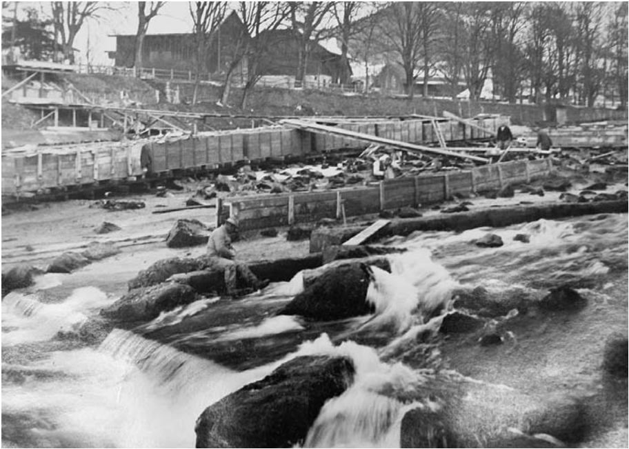
Abb. 3 Bauarbeiten an der Aaresohle im Schwäbis, zwischen 1916 und 1926. Wegen der Rückwärtserosion der Aare nach der Aare-Zulg-Korrektion musste im Schwäbis die Flusssohle ab 1877 in mehreren Etappen mit Steinblöcken gesichert werden. Damals entstanden die Aarefälle. Zu Beginn der 1960er-Jahre verschwanden diese im Rückstau des Wehrs, das damals für den Betrieb des neuen Elektrizitätswerkes errichtet wurde.

konnte die Unterspülung der Ufer zwar vermindert, aber nicht ganz gestoppt werden. Die Folgen dieser Gewässerkorrektion sind heute im Schwäbis eindrücklich sichtbar. Während die Aare vor der Korrektion noch gemächlich, mit wenig Gefälle und in weitem Bogen durch das Schwäbis Bern zufloss, stürzt das Wasser heute beim Stauwehr des Elektrizitätswerks rund sieben Meter in die Tiefe. 16